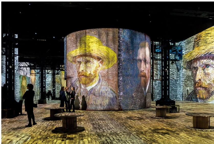
Atelier des Lumières in Paris, France