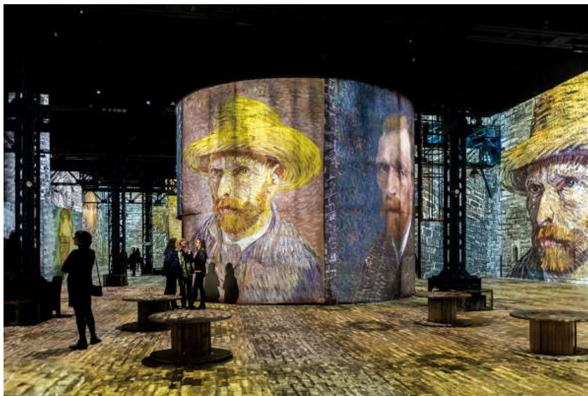
Atelier des Lumières in Paris, France