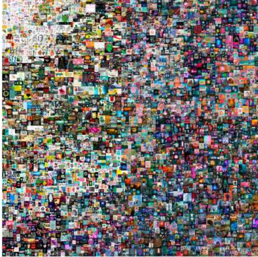
Everydays: the First 5000 Days by Beeple